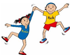
Muck und Minchen aus Baden

Da euch wahrscheinlich nicht alle Maskottchen bekannt sind, möchten wir euch diese noch vorstellen: