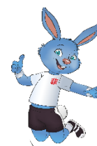
Turni aus Schwaben